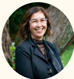
Rawinia Higgins 教授 副校长 惠灵顿维多利亚大学

我们的大学;我们的员工;我们的学生以及我们的学生社团都已经做好准备,我们将尽全力支持你,让你的留学之旅充满意义!